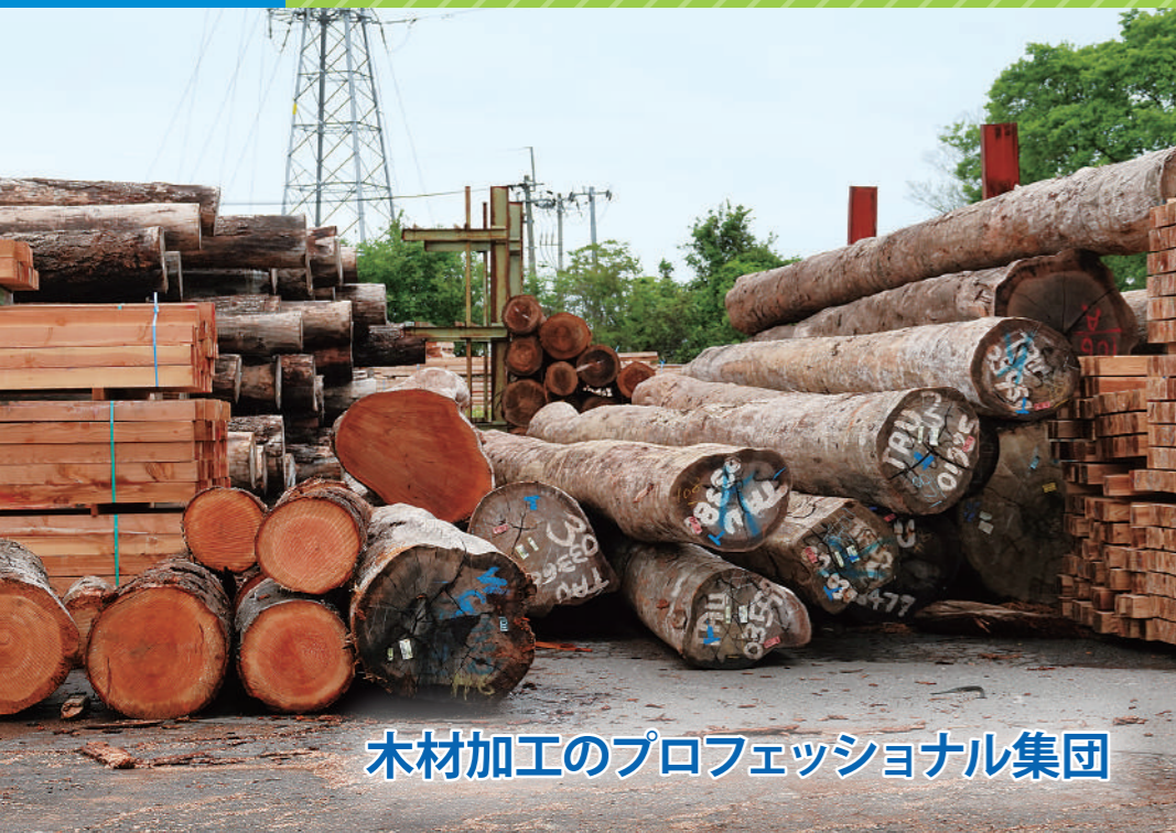
木材加工のプロフェッショナル集団